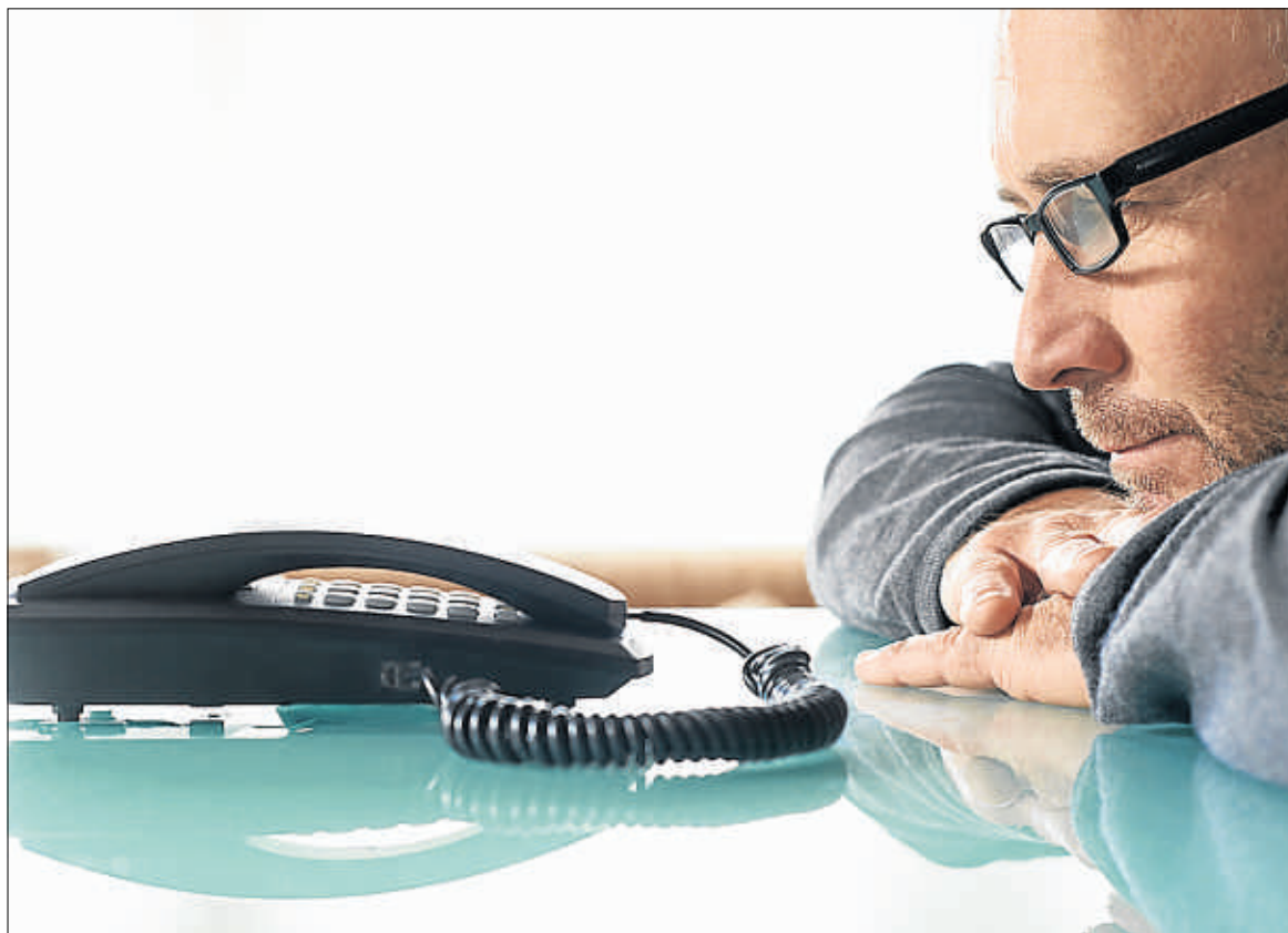
Esperar una trucada que no arriba, per una entrevista de feina, esdevé frustrant per al candidat