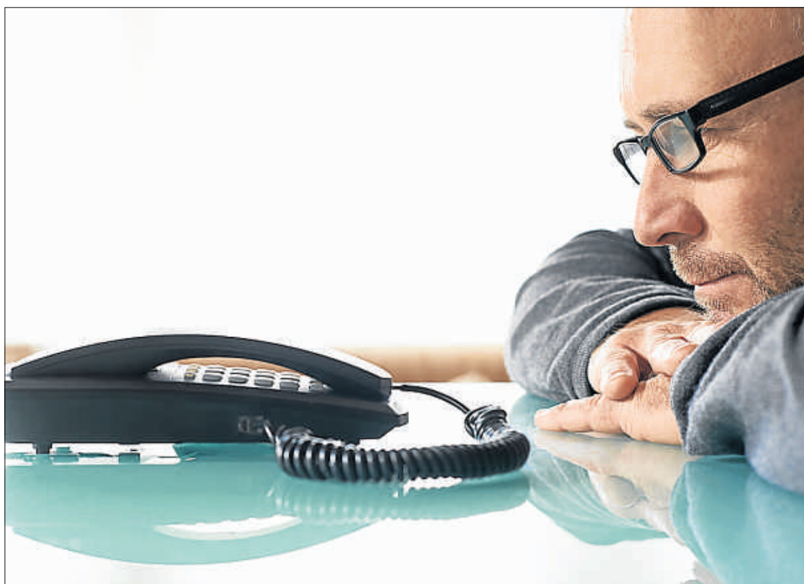
Esperar una llamada que no llega, para una entrevista de trabajo, resulta frustrante para el candidato